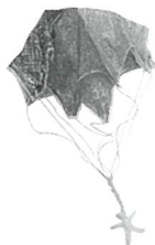
【青空パラシュート】