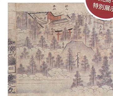
《大麻山境内図》部分 1592 (天正 20) 年 大麻山神社蔵 (浜田市三隅町室谷) 島根県指定文化財

本展では、石本正の心や祈りが表れた作品 36 点に加え、各国を旅した足跡や貴重な資料を展示。旅先での風景スケッチの数々や、故郷石見への祈りの心を込めた日本画作品をご覧いただけます。また当館での初めての試みとして、浜田市内の貴重な文化財 4 点を特別展示しています。